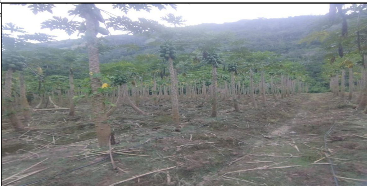
FIGURA N°03: CULTIVOS DE PAPAYA EXPUESTOS ANTE UNA CRECIDA DEL RÍO POZUZO EN LA MARGEN DERECHA.