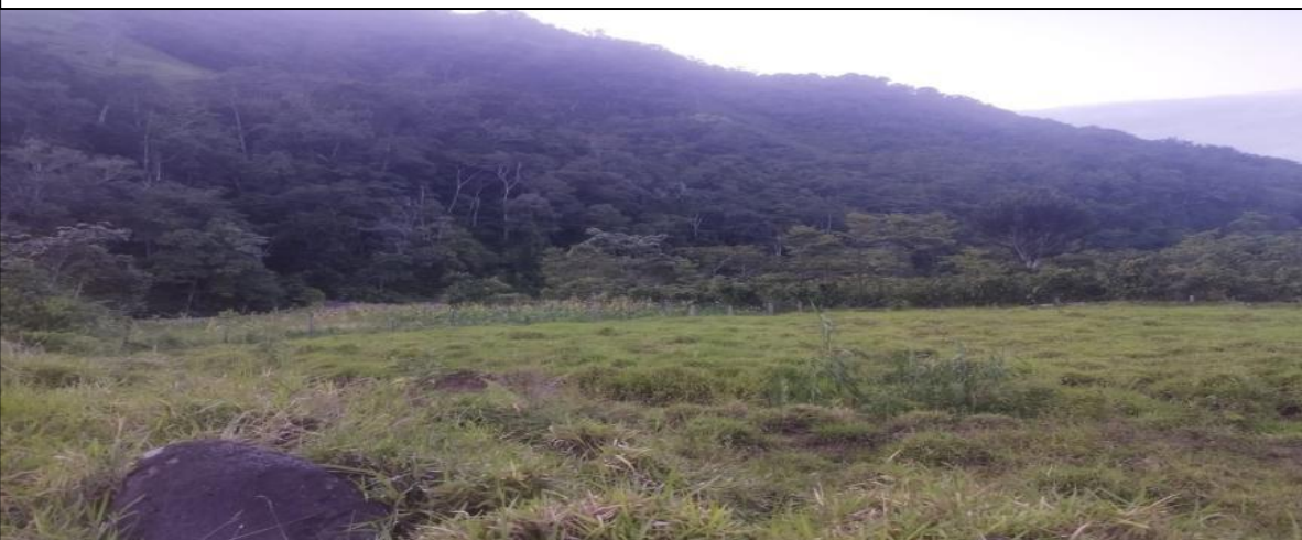
FIGURA N°03: CULTIVOS DE MAIZ , CITRICOS Y CACAO EXPUESTOS ANTE UNA CRECIDA DEL RÍO POZUZO EN LA