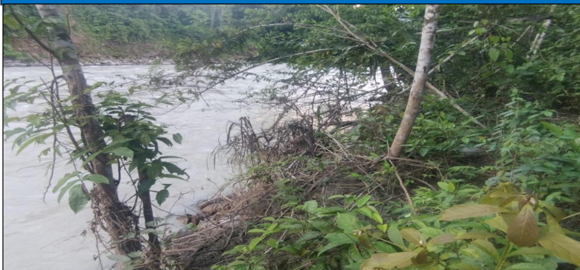
FIGURA N°01: TRAMO CRÍTICO EN EL RÍO POZUZO , EN EL SECTOR SANTA ROSA, DISTRITO DE POZUZO, PROVINCIA DE